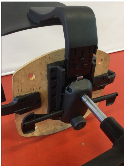
Vista da sotto

La denominazione e l'eventuale descrizione del campione sono dichiarate dal cliente; il CATAS non s'impegna a verificarne la veridicità. I risultati riportati sul rapporto di prova si riferiscono solo al campione provato. Aggiunte, cancellazioni o alterazioni non sono ammesse. Il rapporto di prova non può essere riprodotto parzialmente. Se non diversamente previsto da norme, specifiche tecniche o accordi con il cliente le eventuali dichiarazioni di conformità formulate dal CATAS si basano sul confronto tra i risultati ed i valori di riferimento senza considerare l'intervallo di confidenza della misura. Salvo diversa indicazione, il campionamento è stato effettuato dal cliente: in tal caso i risultati ottenuti si considerano riferiti al campione così ricevuto.