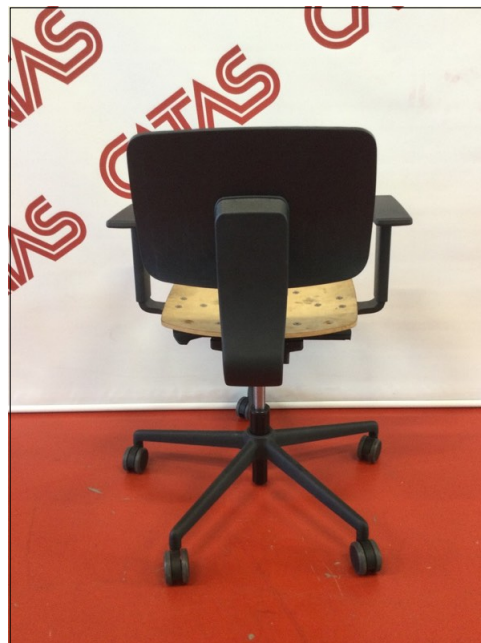
Vista da dietro