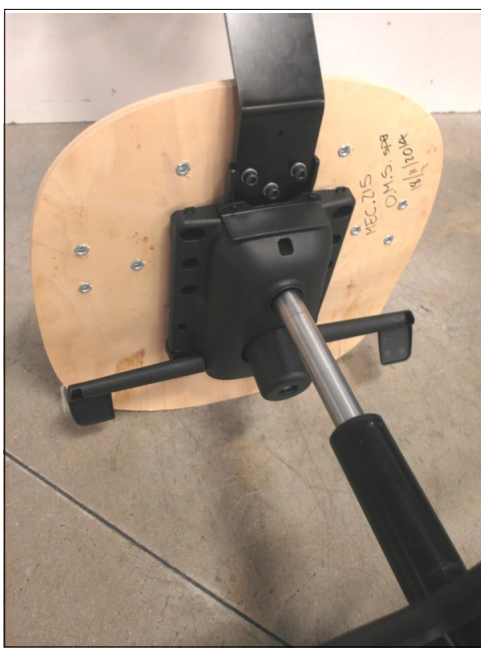
Vista da sotto