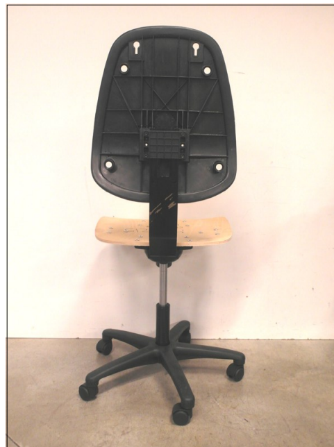
Vista da dietro