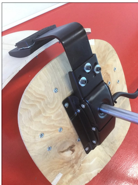
Vista da sotto

La denominazione e l'eventuale descrizione del campione sono dichiarate dal cliente; il CATAS non s'impegna a verificarne la veridicità. I risultati riportati sul rapporto di prova si riferiscono solo al campione provato. Aggiunte, cancellazioni o alterazioni non sono ammesse. Il rapporto di prova non può essere riprodotto parzialmente. Se non diversamente previsto da norme, specifiche tecniche o accordi con il cliente le eventuali dichiarazioni di conformità formulate dal CATAS si basano sul confronto tra i risultati ed i valori di riferimento senza considerare l'intervallo di confidenza della misura. Salvo diversa indicazione, il campionamento è stato effettuato dal cliente: in tal caso i risultati ottenuti si considerano riferiti al campione così ricevuto.