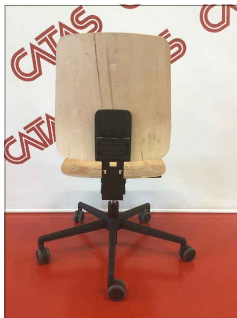
Vista da dietro